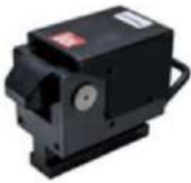
Penutup anti debu + penyegelan tahan panas + gagang