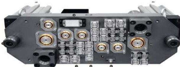
900kN Mesin Blow Molding