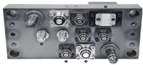
5,000kN Mesin Die Casting