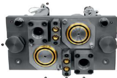
12,000kN Hot Press