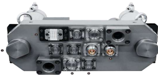
5,000kN Mesin Die Casting