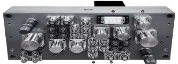
900kN Mesin Blow Molding