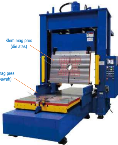
Klem mag pres (die atas)