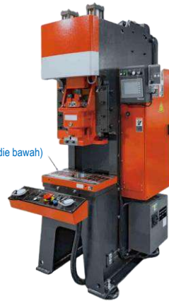
Klem mag pres (die bawah)