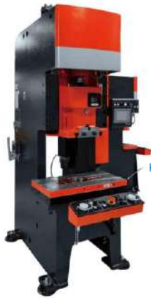
Klem mag pres (die bawah)